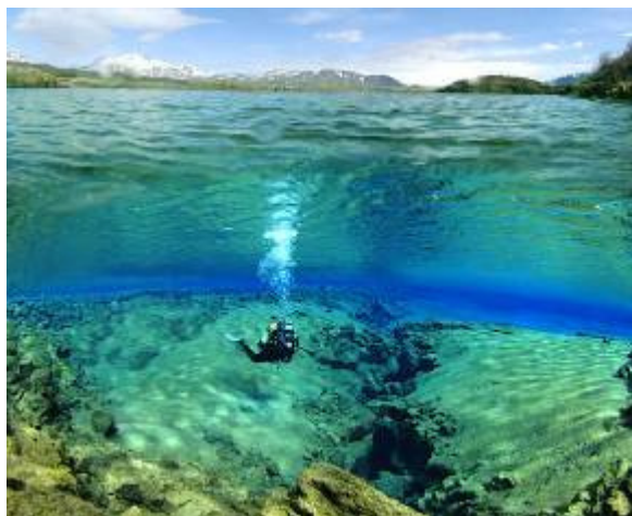
Diving day tour, Iceland

Al mismo tiempo podrás aprovechar para descubrir un fascinante país de glaciares, fuentes termales, géiseres, volcanes en actividad, extensos desiertos de lava y arenas negras. Pregúntanos.